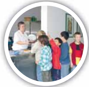
Gemeinsames Mittagessen und Betreuungsarbeit – Alltag bei der Offenen Ganztagschule.

Eröffnung von 19 weiteren Offenen Ganztagschulen (OGS) in Bonn. Darunter befinden sich drei Schulen in der Trägerschaft des Diakonischen Werkes. Später kommen zwei weitere Schulen hinzu.