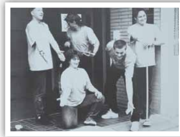
„Tag der offenen Tür“ anlässlich des Umzugs in die Kaiserstraße.