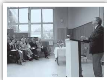
Eröffnungsfeier der neuen Beratungsstelle für Pränatal-Diagnostik.