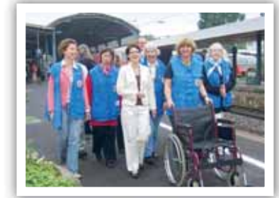
Mitarbeiterinnen der Bahnhofsmission.

Eröffnung eines Klettergartens für die Suchtprävention – in Zusammenarbeit des Diakonischen Werkes, des Caritasverbandes für die Stadt Bonn e.V. und der Jugendakademie Walberg. Unter dem Motto „NEIN sagen lernen, Selbstbewusstsein erproben“ sollen Jugendliche Mögliches austesten und Grenzen erfahren.