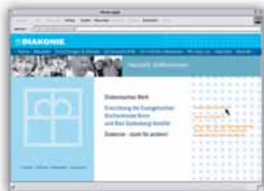
Erste Überarbeitung der Internetpräsenz im Dezember 2003.